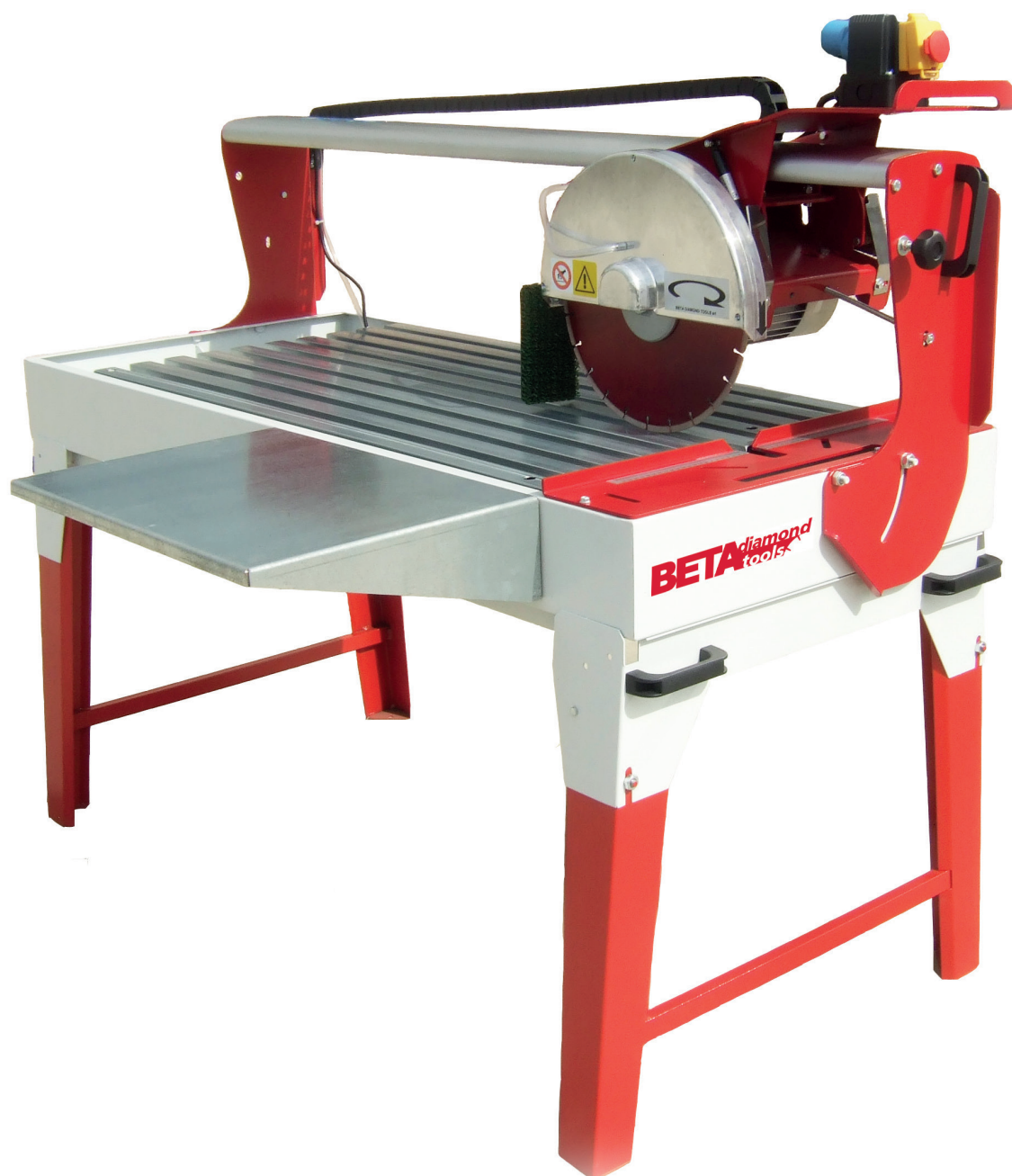
SEGATRICI DA CANTIERE AD ACQUA MASONRY SAWS