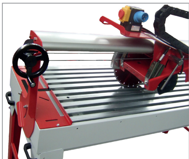
AVANZAMENTO A MANOVELLA MOVEMENT WITH HAND CRANK