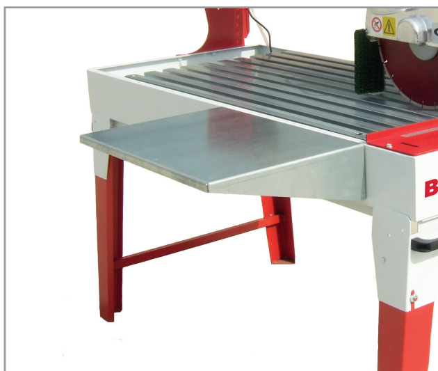
PIANO DI LAVORO ADDIZIONALE ADDITIONAL WORKTOP